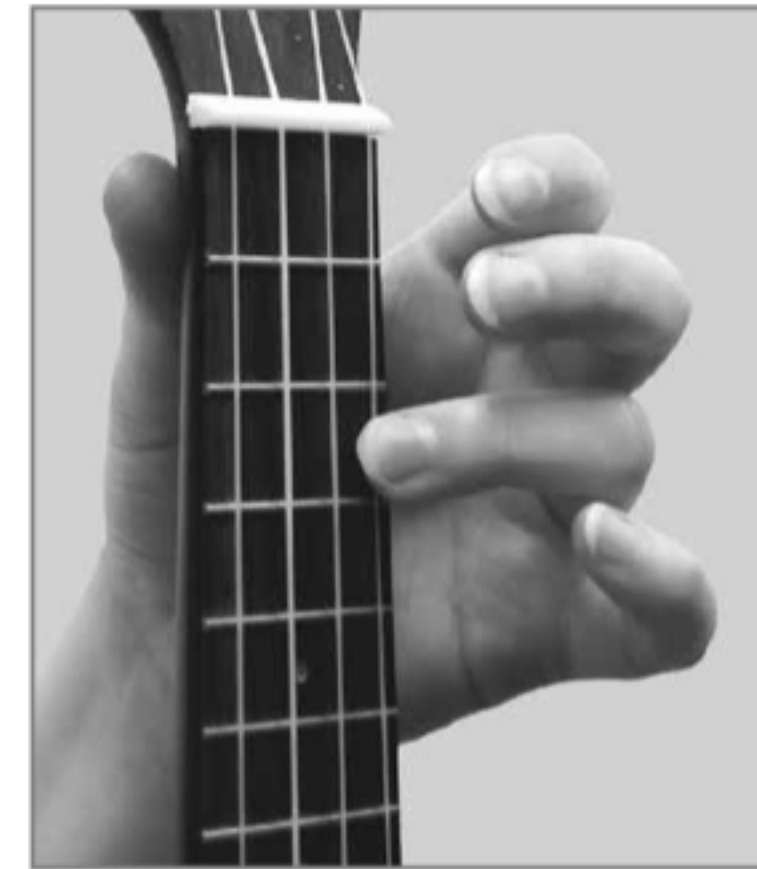
Greife mit dem Ringfinger im dritten Bund der A-Saite.

Ein Akkord besteht aus wenigstens drei Tönen!